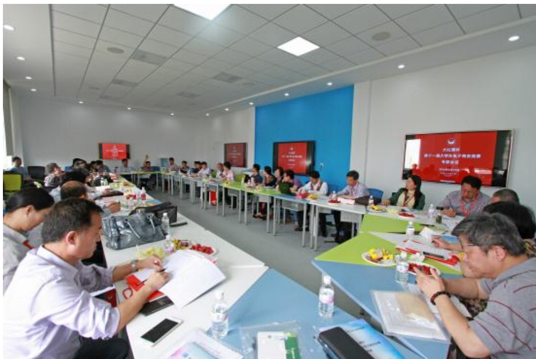
图 4 专家会议