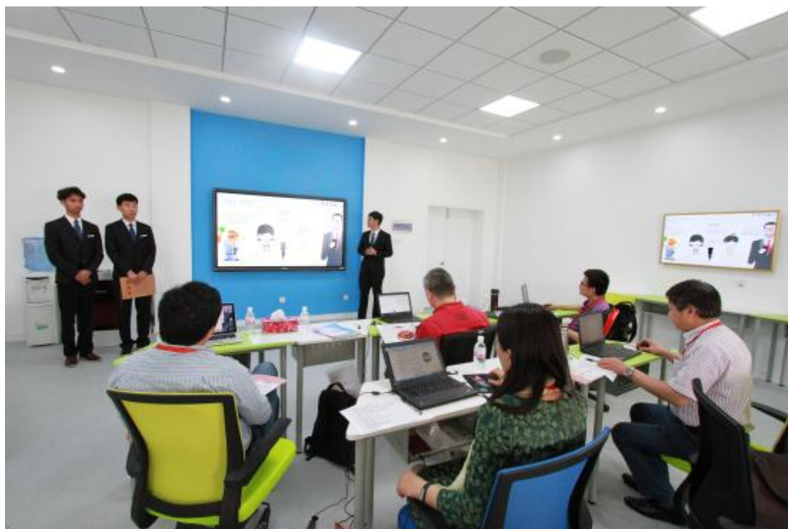
图 1 本科商务类参赛队伍答辩现场

浙江省大学生电子商务竞赛是由浙江省教育厅主办的 A 类学科竞赛，自 2006 年起，浙江工商大学已经连续 11 年承办了这一竞赛，并为五届全国大学生电子商务“创新、创意及创业”挑战赛选送了大量优秀的作品。浙江省大学生电子商务竞赛培养出了一大批具有创新创业能力的优秀学生，通过竞赛活动，提高了学生在电子商务方面理论与实践相结合的能力，培养和树立了大学生的创新意识，丰富和活跃了校园文化氛围，为社会发展需要输送了大量电子商务方面的优秀人才。