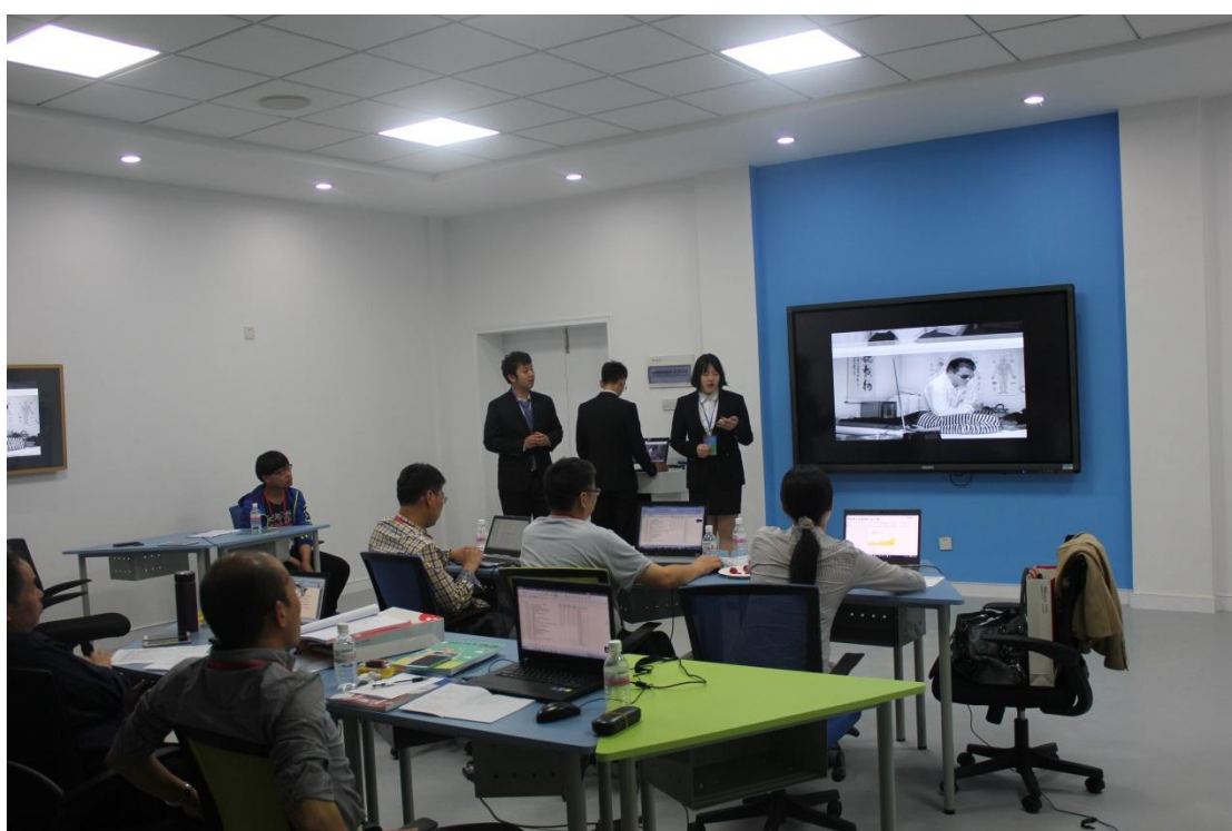
图 3 本科技术类参赛队伍答辩现场