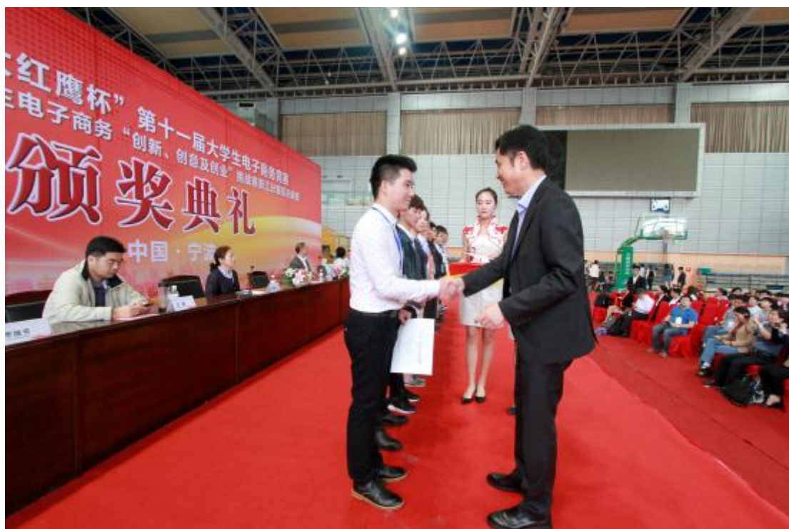
图 6 一等奖获奖选手领奖