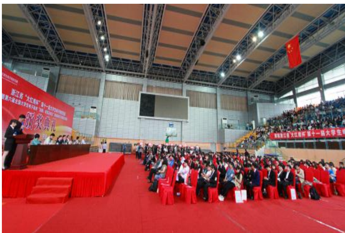
图 5 颁奖典礼现场